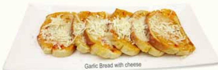
Garlic Bread with cheese

ΝΤΑΚΟΣ κρητικό κρίθινο παξιμάδι με φρέσκια τομάτα, ελαιόλαδο & φέτα "DAKOS" Village barley dry bread with tomato, olive oil & feta "DAKOS" Bauernzwieback mit Tomate, Olivenöl & Feta Käse "DAKOS" pain sec crétois à la tomate, huile d'olive & fromage feta