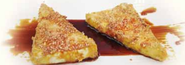
Fried Feta Cheese