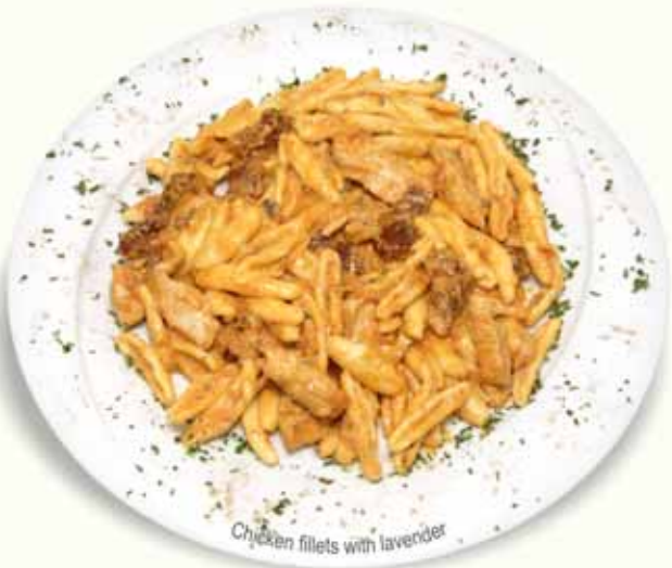
Chicken fillets with lavender