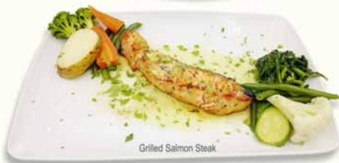
Grilled Salmon Steak

ΦΡΕΣΚΟ ΨΑΡΙ ΣΧΑΡΑΣ μερίδα 250g GRILLED FRESH FISH portion 250g FRISCHER FISCH GEGRILLT Portion 250g POISSON FRAIS GRILLÉ portion 250g