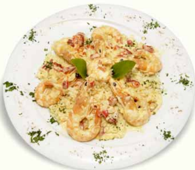
Shrimps with ouzo flambe