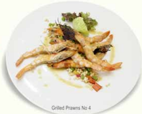
Grilled Prawns No 4