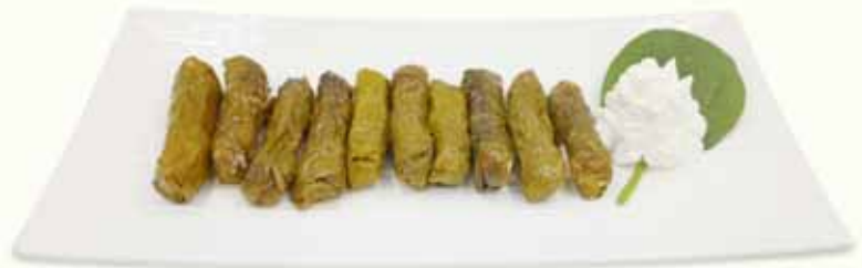
Stuffed Vine Leaves

ΜΑΡΑΘΟΠΙΤΑ FENNEL PIE FENCHELTASCHEN FEUILLETÉS AUX FENOUILLES