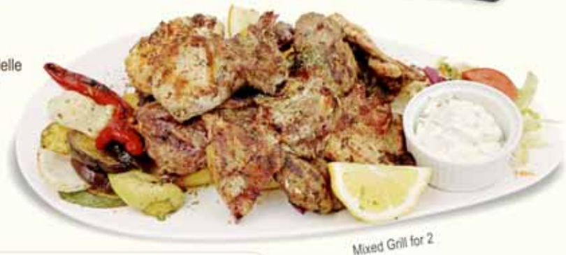
Mixed Grill for 2

Τα φιλέτα μας ψήνονται με 5 διαφορετικούς τρόπους, επιλέξτε ανάμεσα σε :