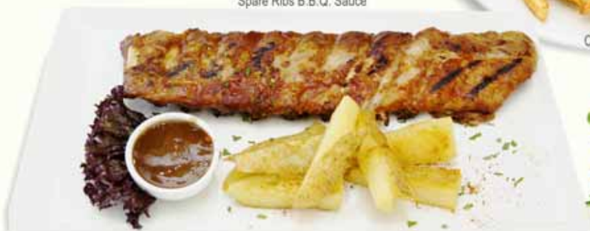
Spare Ribs B.B.Q. Sauce