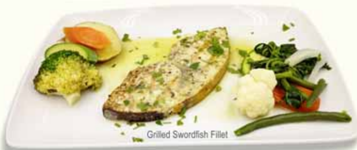
Grilled Swordfish Fillet

ΞΙΦΙΑΣ ΦΙΛΕΤΟ ΣΧΑΡΑΣ GRILLED SWORDFISH FILLET SCHWERTFISCHFILET GEGRILLT FILET D' ESPADON GRILLÉ