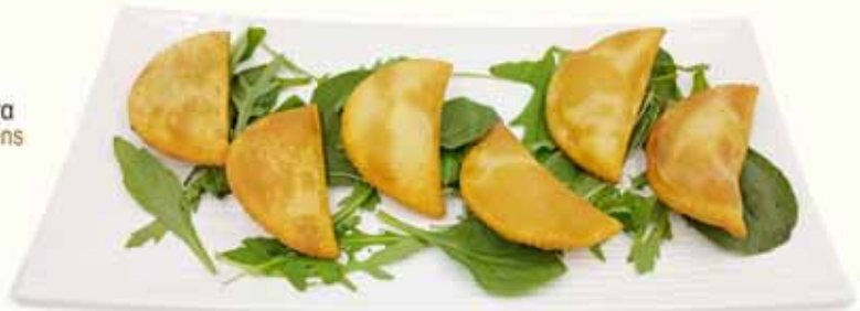
Herb - Pies

ΧΟΡΤΟΠΙΤΑΚΙΑ ΣΠΙΤΙΚΑ με άγρια κρητικά χόρτα HERB - PIES HOMEMADE with wild Cretan greens GEMÜSETASCHEN HAUSGEMACHT mit wildem grünem Gemüse FEUILLETÉS AUX HERBES SAUVAGES