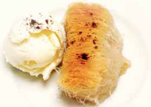
Kataifi with ice cream

ΚΑΤΑΪΦΙ ΜΕ ΠΑΓΩΤΟ KATAIFI with ICE CREAM KATAIFI MIT EIS KATAIFI Á LA GLACE