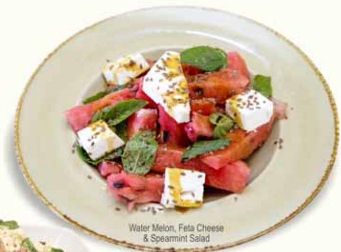
Water Melon, Feta Cheese & Spearmint Salad