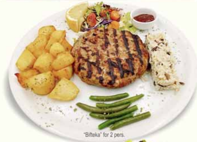
"Bifteka" for 2 pers.

ΚΟΤΟΠΟΥΛΟ ΣΧΑΡΑΣ GRILLED CHICKEN HUHN GEGRILLT POULET GRILLÉ