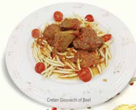
Cretan Grouvechi of Beef