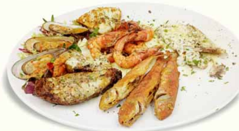
Triumph of the sea for 2 pers.

ΑΝΑΜΙΚΤΑ ΘΑΛΑΣΣΙΝΑ MIXED SEAFOOD grilled sardines, fried squid, octopus, prawns, mussels, grilled vegetables and potatoes MEERESFRÜCHTETELLER FRUITS DE MER MIXTES