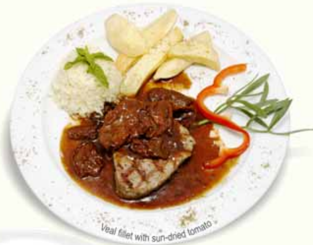
Veal fillet with sun-dried tomato