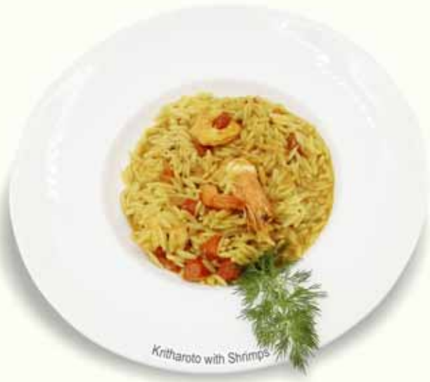
Kritharoto with Shrimps