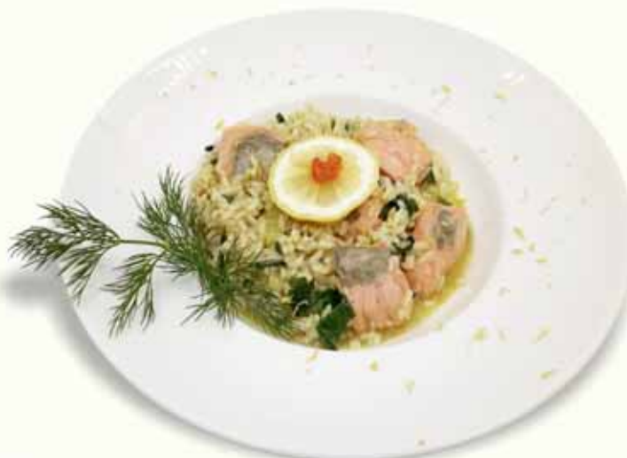
Risotto with salmon

* ΓΑΡΙΔΕΣ ΟΥΖΟΥ ΦΛΑΜΠΕ με ρυζότο, κρέμα γάλακτος & ούζο SHRIMPS WITH OUZO FLAMBÉ with risotto, milk cream & ouzo GARNELEN MIT USO FLAMBÉ mit Risotto, Milchrahm & Uso CREVETTES FLAMBÉES À L'OUZO avec du risotto, crème fraîche & ouzo