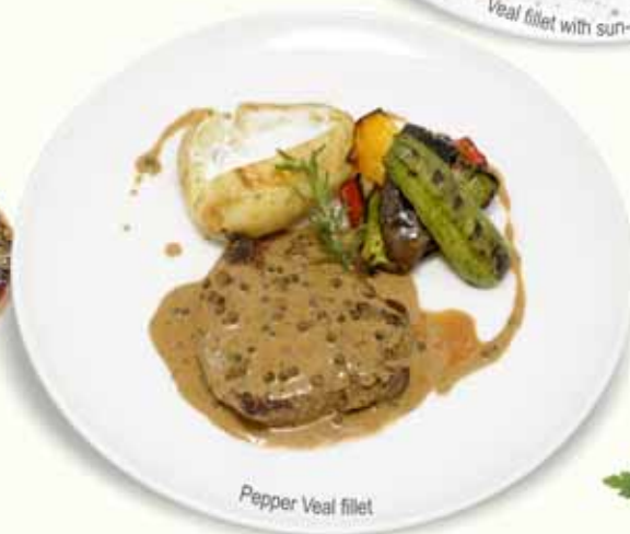
Pepper Veal fillet