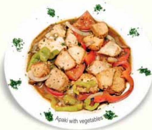
Apaki with vegetables

ΚΟΛΟΚΥΘΑΚΙΑ ΤΗΓΑΝΗΤΑ FRIED COURGETTES FRIERIETE ZUCCHINI COURGETTES FRITES