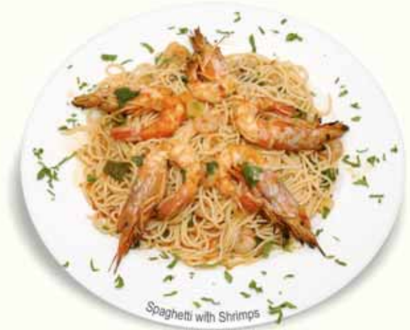
Spaghetti with Shrimps