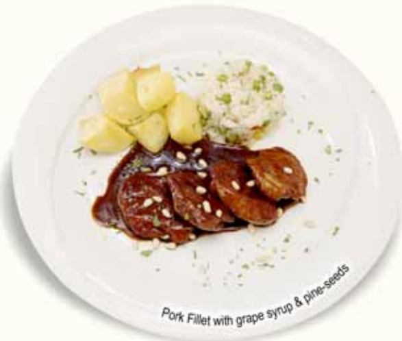
Pork Fillet with grape syrup & pine-seeds