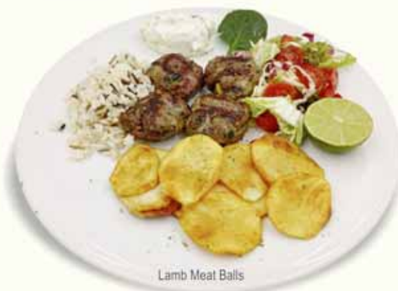
Lamb Meat Balls