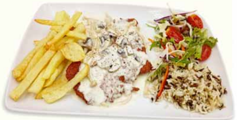
Schnitzel a la creme