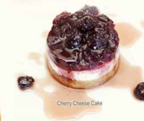
Cherry Cheese Cake

ΦΡΟΥΤΟΣΑΛΑΤΑ για 2 άτομα FRUIT SALAD for 2 pers. OBSTSALAT für 2 Pers. SALADE DE FRUITS pour 2 pers.