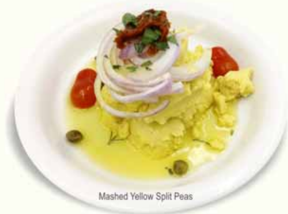
Mashed Yellow Split Peas