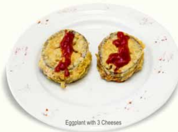
Eggplant with 3 Cheeses